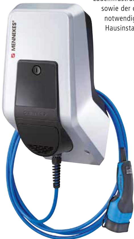
Ladestation der Firma Mennekes Foto: Mennekes

Selbstverständlich beraten wir Sie auch bei der Auswahl der passenden Ladeinfrastruktur sowie der dafür notwendigen Hausinstallation.