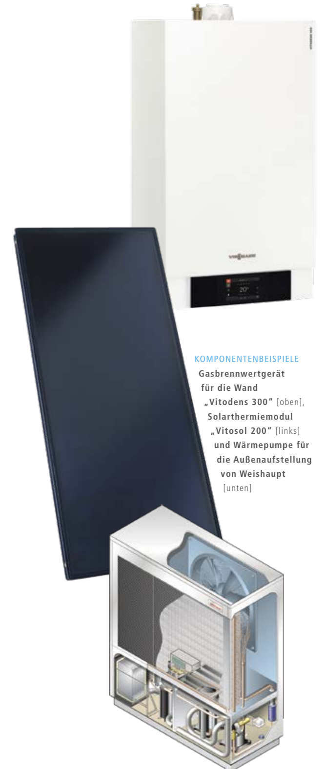
KOMPONENTENBEISPIELE Gasbrennwertgerät für die Wand „Vitodens 300“ [oben], Solarthermiemodul „Vitosol 200“ [links] und Wärmepumpe für die Außenaufstellung von Weishaupt [unten]