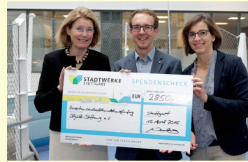
SPENDENÜBERGABE AN DIE STIFTUNG

Die Teilnehmer unserer Aktion „Kunden werben Kunden“ zu Gunsten der Olgäle Stiftung für das kranke Kind e.V. haben in den vergangenen zwölf Monaten 2850 Euro gespendet. Dafür bedankt sich die Stiftung bei den Stadtwerke-Kunden. Die Aktion funktioniert ganz einfach: Wer einen Neukunden wirbt, erhält von den Stadtwerken als Dankeschön