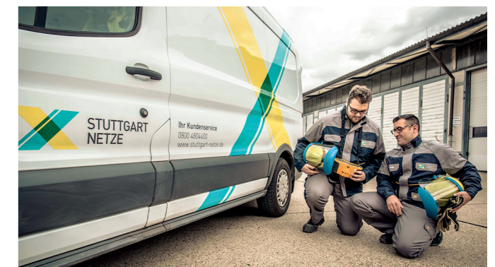
ZWEI MITARBEITER DER STUTTGART NETZE VOR IHREM NEUEN SERVICEFAHRZEUG

Die Stuttgart Netze Betrieb GmbH ist ein Gemeinschaftsunternehmen von Stadtwerken